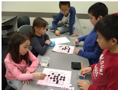
围棋数学课上同学们玩游戏