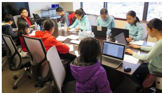
同学们在侨报办公室作文比赛